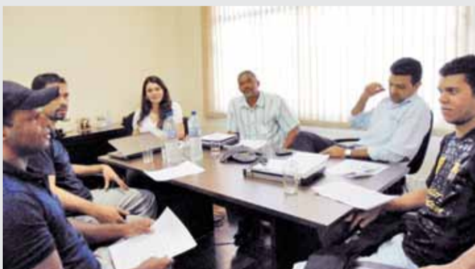
Comissão, Sindicato e empresa em negociação da PLR

A Dayco é uma empresa que se instalou em Contagem há três anos. Desde que chegou