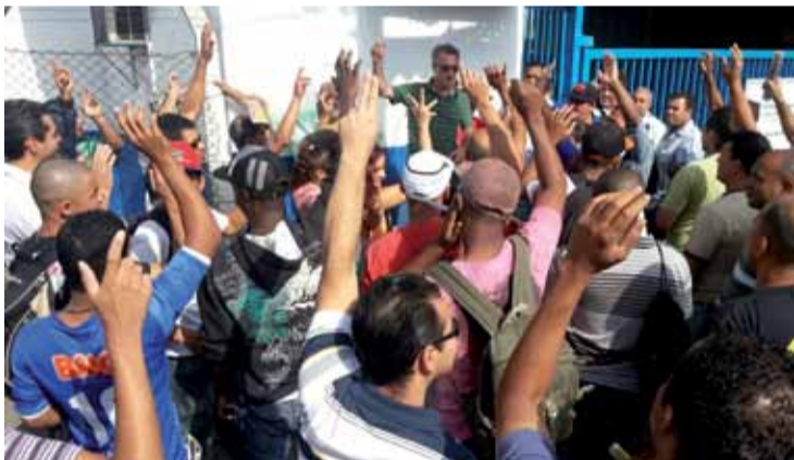
Assembleia com os trabalhadores do turno da tarde