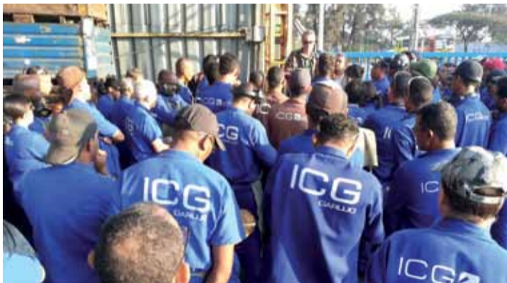
Assembleia com os trabalhadores do turno da manhã

Na próxima segunda-feira (05), tem reunião com a direção da empresa e caso ela não avance nas suas propostas, a fábrica poderá parar por tempo indeterminado.