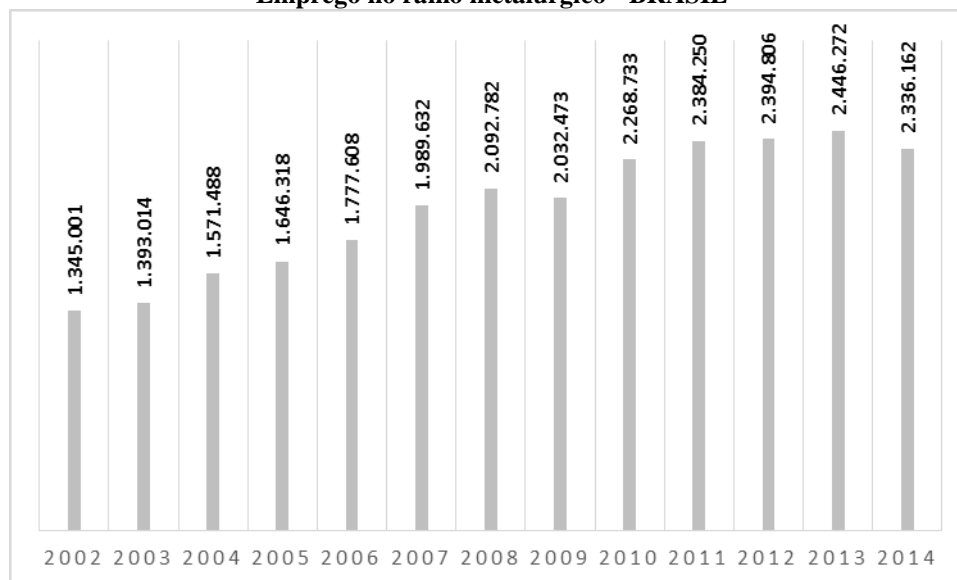
GRÁFICO 1 Emprego no ramo metalúrgico - BRASIL

No período de 2002 a 2014 o emprego no ramo metalúrgico brasileiro cresceu 73,69%, saindo de 1,34 milhões de trabalhadores no ano de 2002, e atinge 2,33 milhões de trabalhadores no ano de 2014.